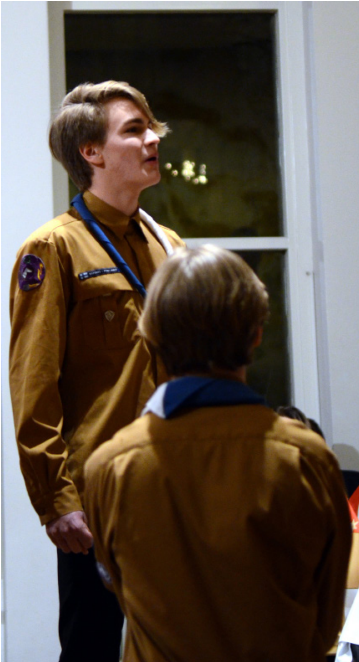
Vartionjohtajat näyttivät mallia kuinka tiernapoikia esitetään