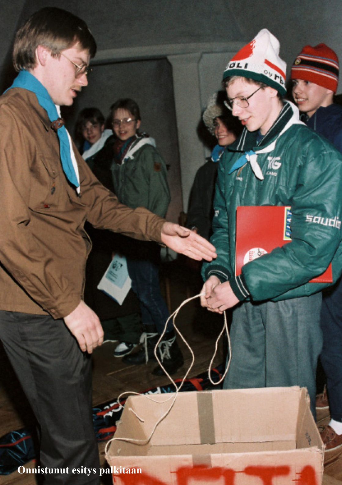
Onnistunut esitys palkitaan