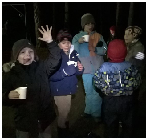
Hirvikarhut juovat mehua