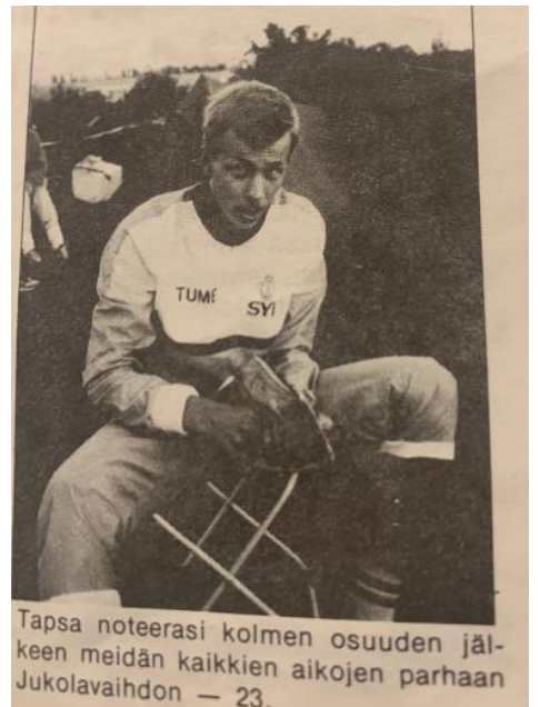
Tapsa noteerasi kolmen osuuden jälkeen meidän kaikkien aikojen parhaan Jukolavaihdon - 23.