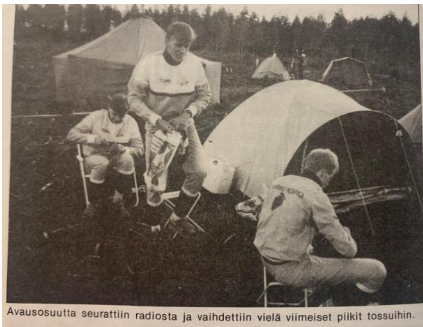
Avausosuutta seurattiin radiosta ja vaihdettiin vielä viimeiset piikit tossuihin.