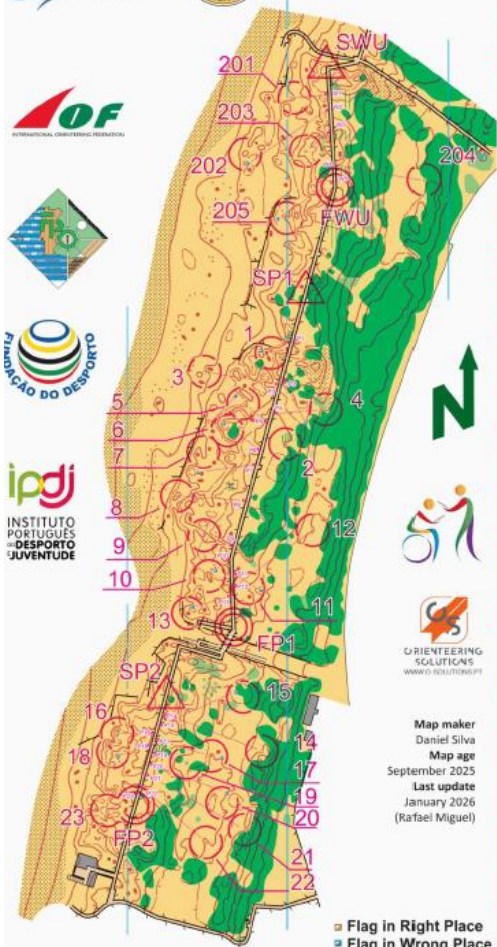
POM 2026 PreO Sprint 14/02/2026